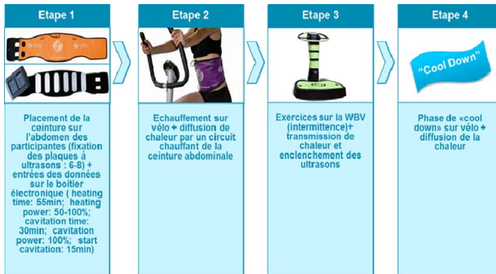
Fig. 1 Déroulement de la séance d'activité physique sur la plateforme vibratoire associée aux ultrasons pour le groupe VIB+US